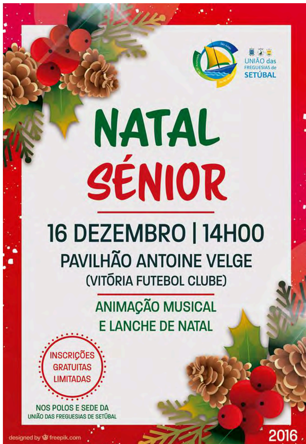
Anexo 2 – “Natal Sénior”: Festa de Natal dedicada à comunidade sénior da União das Freguesias de Setúbal