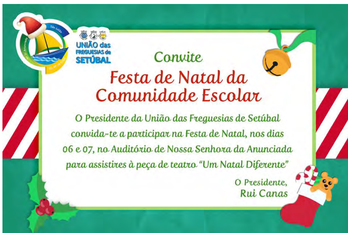
Anexo 1 – Festa de Natal da Comunidade Escolar