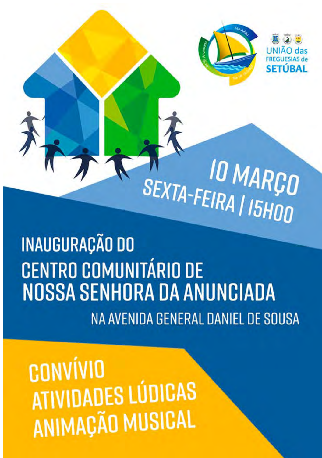
Anexo 4 – Inauguração do Centro Comunitário de Nossa Senhora da Anunciada