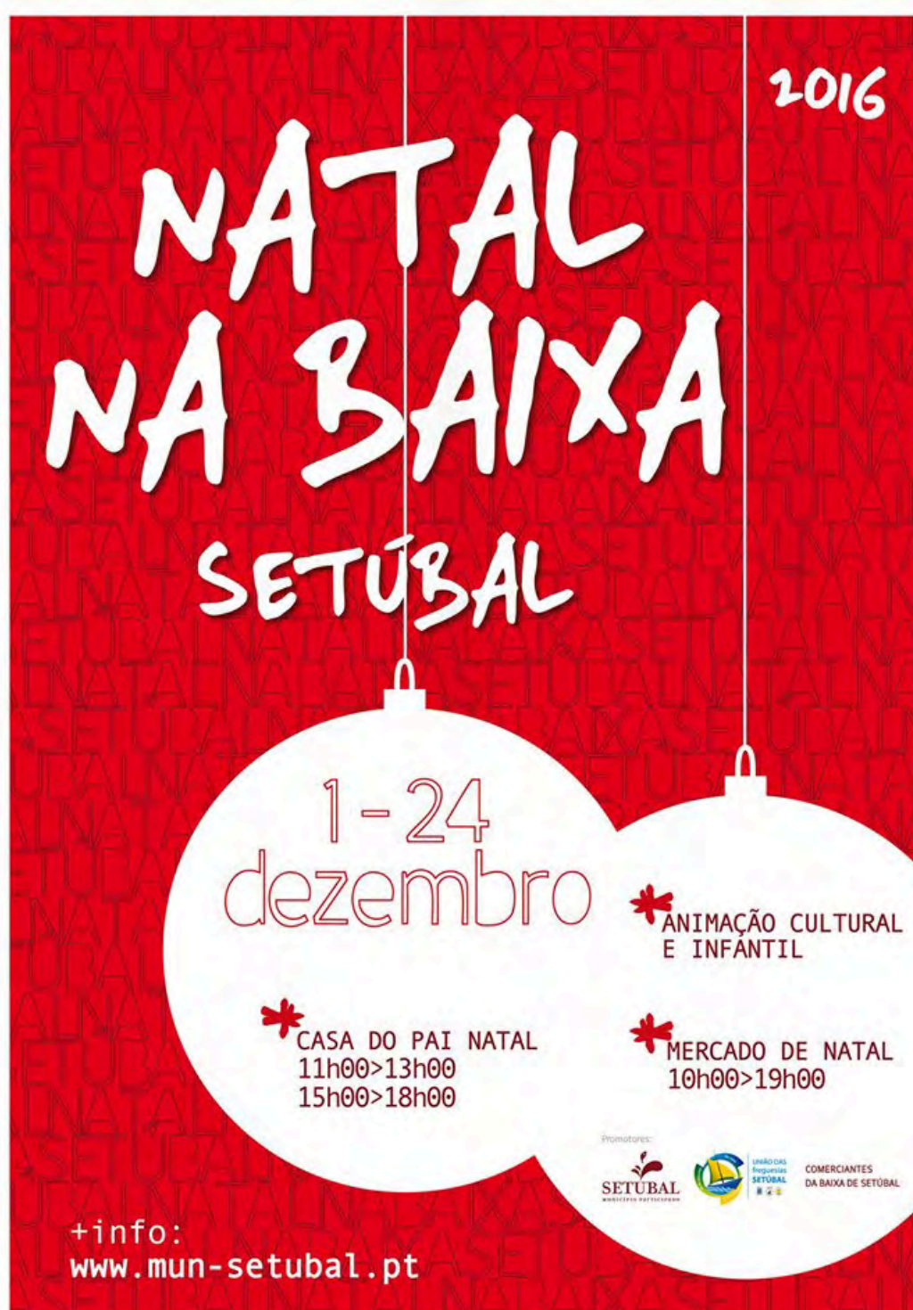
Anexo 3 – Programa “Natal na Baixa” de 2016