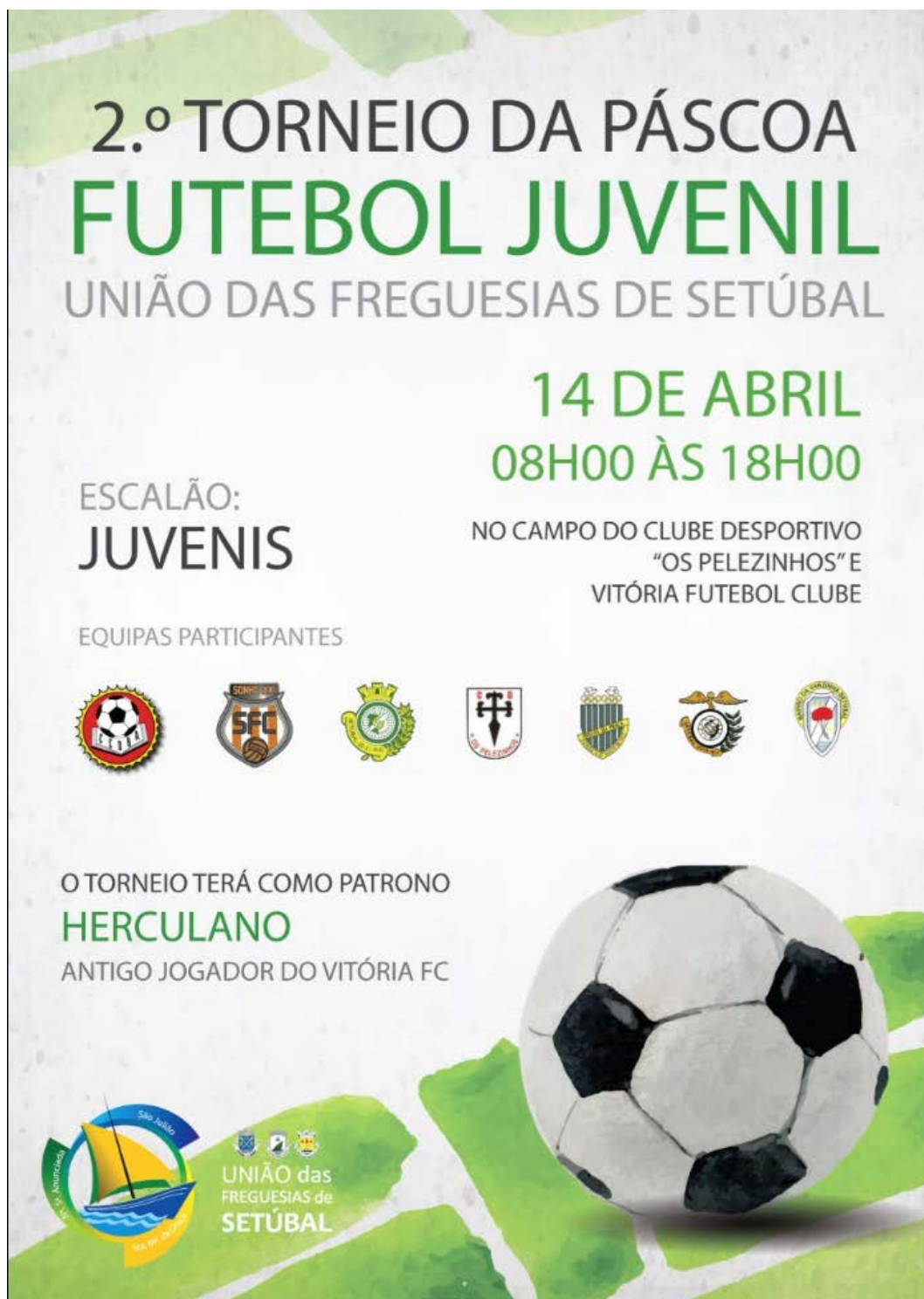
Anexo 2 – 2.º Torneio da Páscoa de Futebol Juvenil da União das Freguesias de Setúbal